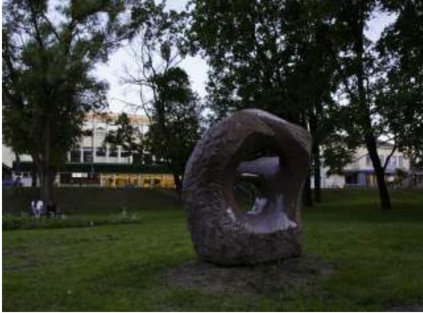
Skulptūra „Atgimimas“ (autorius Jonas Šimonėlis)

Gamtoje taip jau surėdyta – mirštam, kad atgimtume. Žiūrėkim, kad Visatoje – gausybė žvaigždžių susitraukia į absoliutų nulį, juodąją skylę ir staiga – sproginas. Vėl erdvę užpildo naujos žvaigždės su savo gyvybę turinčiomis planetomis. Mes, kaip tauta irgi ne taip seniai atgimėme. Buvome susitraukę iki absoliutaus bolševik iško nulio ir staiga mažos Sąjūdžio iniciatyvinės